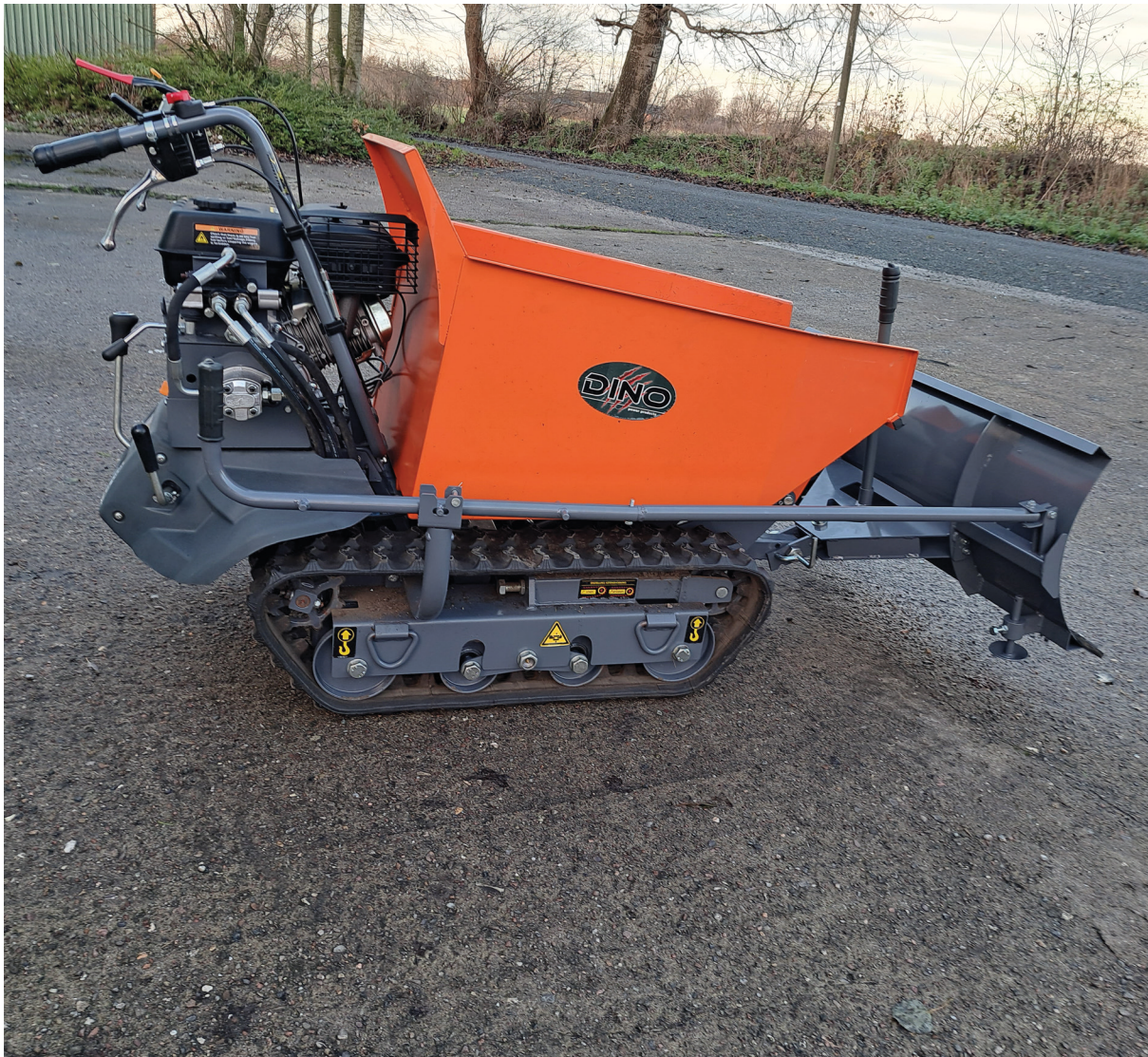
Dumper DD500-03 mit montiertem Schneeschild