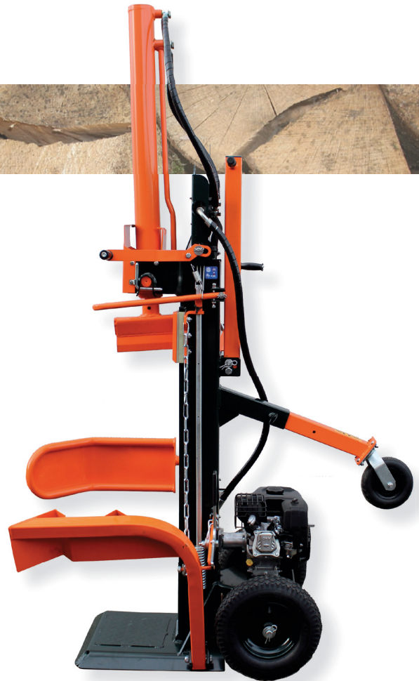
EL 16/110D Pro