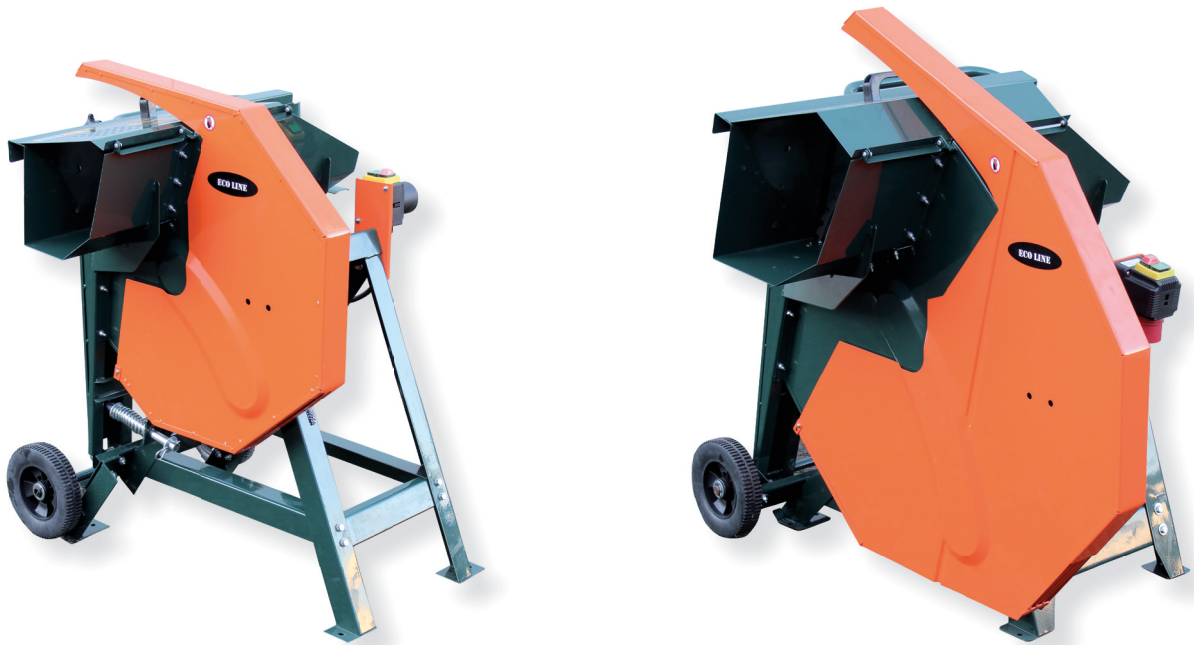
Wippkreissäge EL 3/500W