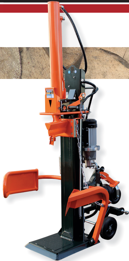
EL 22/110Z Pro