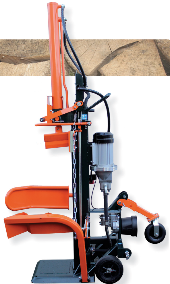
EL 16/110Z Pro